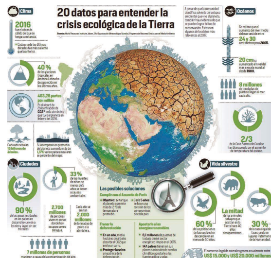
◀ Figura 1 Crisi ecològica.

En efecte, la profunda crisi ecològica [vegeu la Figura 1] i la persistència d'un model econòmic basat en el creixement perpetu i en la recerca del màxim benefici al cost més baix són fenòmens que alteren notablement les condicions òptimes per a l'equilibri dels ecosistemes, la protecció de la biodiversitat i la reproducció de la vida.