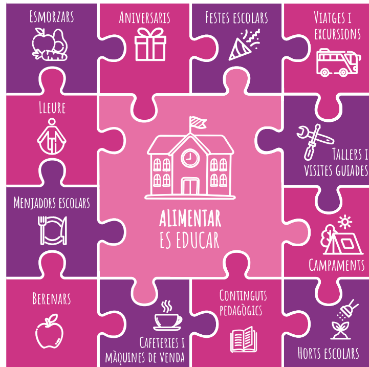
Figura 3 ► Espais d'interacció alimentària en centres educatius.

El que és important en aquest cas no és tant per on comencem com que la nostra reflexió respongui a aquesta mirada global sobre l'alimentació al centre educatiu. D'aquesta manera, la planificació del procés de transició alimentària pot aspirar a aconseguir, a mitjà-llarg termini, que el canvi de model hagi abastat tots els espais on tenen lloc aquestes interaccions alimentàries