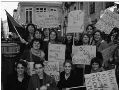
2006ko martxoaren 8ko agerraldia.

Arratsalde euritsu batez, GGKE batek Madrilan dituen bulegoetan, hiru kazetari elkartzen dira bilera batean. Emakumezko kazetari horietako batek aldizkari politiko batean dihardu lanean, beste batek berri-agentzia ekologista batean, eta hirugarrenak GGKE horretan. Mundu osoko emakumeen bizitza hobetzeko moduak buruan dituen beste zenbait emakume bertaratzen da, bere bizitza beste emakumeen bizitzara uztartuta dagoela sentitzen duen talde bat. Guztien artean, emakume jaio den planetako biztanleriaren erdiak nozitzen duen eskubide-eza, bidegabekeria eta