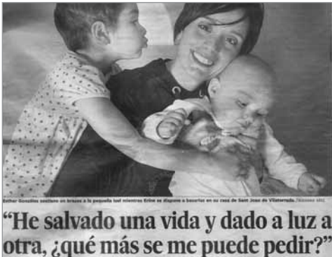
Nazioarteko argitalpena, 2008ko urriaren 26a. El País, Lehenengo orria.

iragarkietan emakumeak nola agertzen diren ikertu baitu bere lanean 6 , bai eta beste hainbat lanetan ere. Irudi horiek haur tankerako emakumeak erakusten dituzte; ahulak, inozoak, otzanak, mendekoak, isilak, pasiboak, zain daudenak; ama diren emakumeak, anonimoak, erasotzen errazak, babesik gabeak, ezagutza-hartzaileak, teknologia- eta botere-eremuetatik at daudenak. Irudi horiek gurean nagusitu den itsutasuna adierazten dute, eta, kasu askotan, nahita eta berariaz eragindako itsutasuna; hots, gizarte-klaseen aurkako bidegabekeriak eta arrazakeria izateaz gain, horiekin biekin lotuta, generoaren bidegabekeriak ere badaudela aitortzea eragozten duen itsutasuna, planetako biztanleen erdiak (gizonak) beste erdiaren (emakumeen) gaineko boterea duela ikusten uzten ez duena.