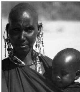
The Reality of Aid, 2008. Azaleko argazkia. Philipines 2008: IBON Books.

Emakume bat ageri da, afrikarra dirudi, bere azalaren koloreagatik, ilean eta belarrietan daramatzen ale koloretsuz eginiko apaingarriengatik; oihal urdina darama garondoan lotuta, sorbaldetako bat estaltzen diola, eta handik haur baten burua ateratzen da, begiak itxita dituela. Emakumea aurrerantz begira dago, baina eguzkiak txikiago egiten dizkio begiak. Ezpainak bereizi gabe, lehenbizi irribarre txiki bat dirudien keinua egiten du, baina poliki so eginez gero, ia begirada kentzera behartzen duen desafio bihurtzen da. Zer dakigu emakume horretaz eta haurraz? Emakumeak bere argazkia erabiltzeko baimenik eman ote al du? Jakingo al du mundu osoan banatuko diren milaka aletako liburuaren aza-