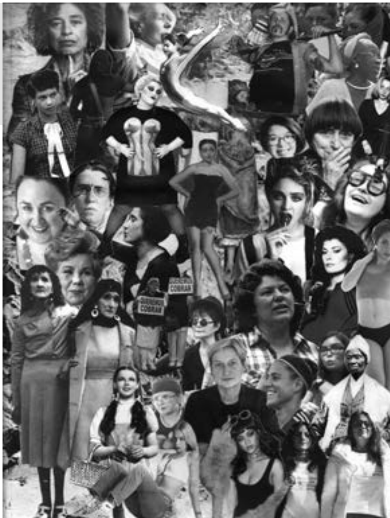
Collagea: Mar Cendón. Revirada Feminista aldizkariaren 3. zenbakiaren azala.

“Ezagutza feministaren zirkuituez” hitz egiten entzun zaitugu. Nola eta zein espaziotan sortzen da ezagutza feminista? Nola partekatzen da eta nondik igarotzen da?