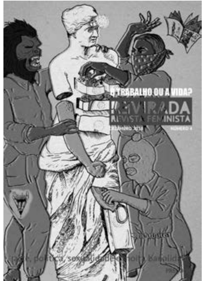
Revirada aldizkari feministak utzitako irudia.

6. zenbakia, Háum elefante na sala , 2020ko apirilean argitaratu zen, pandemiaren erdian. Feminismoaren barruan gehien molestutzen duten gaiak buruzkoa da: feminismo arrazista, klasista edo "male-friendly"-a, bai eta prostituzioarekiko jarrerak, TERFSak, amatasu-