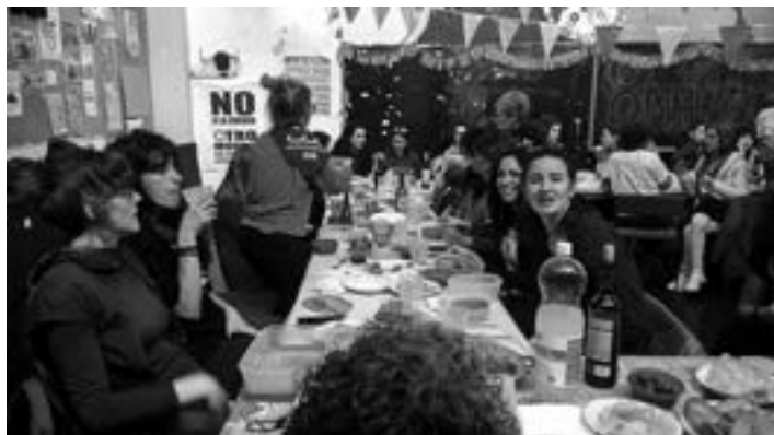
La Prospe Herri Eskolak utzitako irudia.

Barne eztabaidak ditugu, eta ezagutza eta argumetario propioa sortzen ari gara. Ahaldundu egiten gara hausnarketarako eta ekintza kolektiborako gune komunak eraikiz, jakintzaren oztopo hegemonikoak apurtzen dituen ikuspegiarekin, pertsonala politikoa bihurtuz eta lehiakortasun ezaren, elkartasunaren, errespetuaren, berdintasunaren eta zainketen ikuspegitik lan eginez.