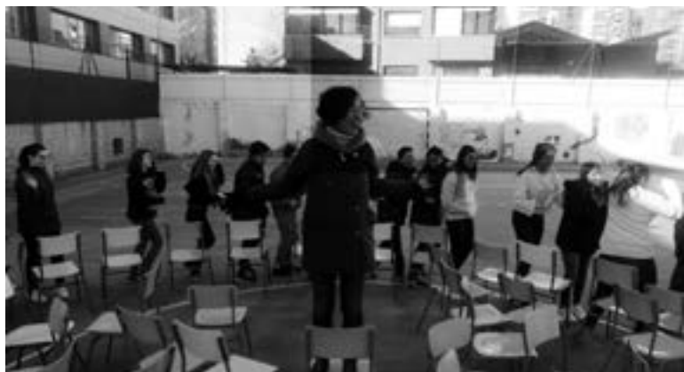
Basurama utzitako irudia.

araudi murriztaile hori aldatu ahalko da? Beste beldurrak gainditu ahalko dira? Baietz espero dugu.