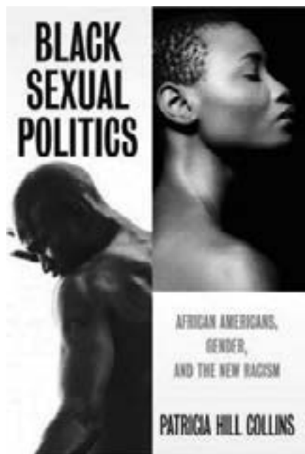
Black sexual politics liburuaren azala.

da emakume horiek zapalkuntza bizitzeko eta erresistentzia egiteko zuten konplexutasuna ulertzea. Hain zuzen ere, konplexutasun horri buruz ari da interseksionalitatea. Gero eta interes handiagoa dago interseksionalitatea azterketa-tresna modura erabiltzeko; izan ere, Sirma Bilgek eta zuk Intersectionality 8 lanean azaltzen duzuen moduan, erreflexiboa da bidegabekeria injustizia sozialarekiko, botere-harremanekiko, harremanen dimentsio sozialarekiko, gizarte-testuinguruarekiko eta konplexutasunarekiko. Sakonago azalduko al zenuke zer interes duen interpretazio-esparru horrek kontzientziazio-prozesuak sustatu nahi dituen eta boterea etengabe berrikusi eta zalantzan jarri behar duen hezkuntzarako?