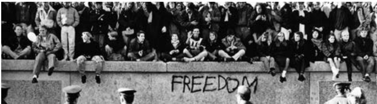
Salhaketak utzitako irudia.

zigor mekanismo batzuek osatzen dituzte. Oso kasu gutxitan dira zigorgabetzera edo zigor esku-hartzea deuseztatzen jotzen duten neurriak, zigor esku-hartzea, delituarekiko erantzun gisa, zigor kontzeptuan edo sarien bidezko sozializazioan oinarritzen ez den beste ekintza mota batez ordezkatuta.