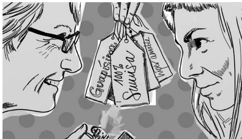
Irudia: © Emma Gascó.

Hasieratik beretik, kazetaritza lanen ordainketak lehentasuna izan dira; izan ere, ahalegina ez da bakarrik argitalpenen kalitatean oinarritu behar, baita kazetarien, ilustratzaileen eta argazkilarien irudia duintzeko zereginean ere, komunikazio enpresek oso gaizki tratatu baitute irudi hori. Are gehiago, beren lanagatik lehen aldiz kobratzeak ahalduintasuna eman die gure lankideetako batzuei, eta, horri esker, kazetaritza edo ilustrazioan freelance gisa jarduteko jautzia eman dute.