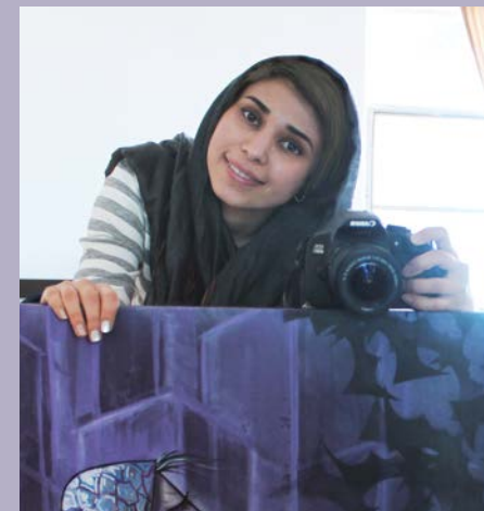
Instagram eta Facebook: Shamsia Hassani

"Birds of No Nation" (Aberririk gabeko txoriak) seriean ikus daitekeenez, azkenaldian migrazioan oinarritu dut nire obra. Afganiarrak beren herrialdetik alde egiten ari dira, eta milaka kilometroko bidaia egiten dute, euren baino nazionalitate hobea eskuratzeko. Hala ere, askatasunaren eta segurtasunaren bila egiten duten bidean, heriotzari, segurtasun ezari eta arrazakeriari egin behar diete aurre.