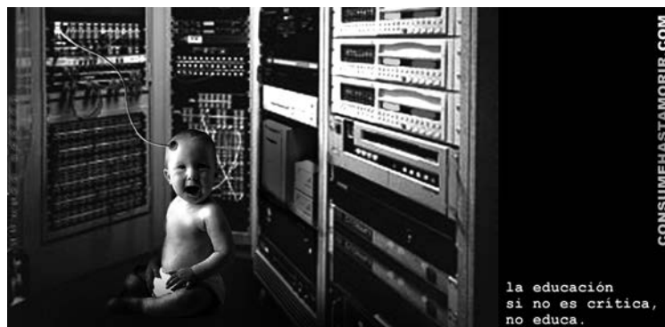
Irudia: © Ecologistas en Acción, ConsumeHastaMorir.

ConsumeHastaMorir taldea sortu eta zenbait hila-betera, hainbat ekintza antolatzen hasi ginen; besteak beste, kontra-publizitate tailerrak, komunikazio sozialari buruzko tutoretzak eta ikasmaterialak, sinesten baikenuen kontra-publizitatearen bitartez kontsumoaren mintzairari (inguratzen gaituzten gauzen mintzaira, alegia) buruzko xehetasunak ezagutu genitzakeela. Aski duzu bere ohiko testuingurutik ateratzea publizitate-iragarki bat (ikur, irudi eta sinbolo bidez eta arreta handiz eraikitako 30 segundoko narratiba hori), eta berehala agertzen zaizkizu horri eusten dioten estrategia komertzialak eta, baita ere, zer-nolako balioek osatzen duten eredu sozioekonomiko horren ideologia neoliberal, normalizatzaile eta legitimatzailea. Beraz, iragarkiak modu kritikoa aztertzea zeharkako tresna bat da; izan ere, askotariko gaiak aztertzeke aukera ematen du, publizitatean bertan agertu adina gai (genero-harremanak, botere-rolak, arrakasta sozialaren estereotipoak, bazterketa eta marjinazioa, ingurunearen iraunkortasuna...), eta ez hori bakarrik: iragarki-egilearen