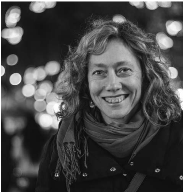
Irudia: © Manuel Ramírez Rovira.

Guiomar: Matxinadaren espazioa topo egitearen errealitate fisikoa da. Hitzak entseatu egiten dira, zeren, horien bidez, gorputzak elkarri hurbiltzen zaizkio etsaitasunik gabe, harreman berriak esperimen-