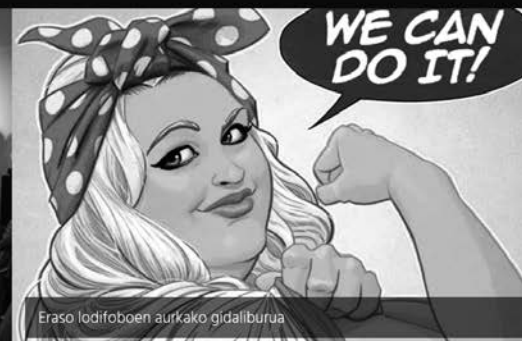
Eraso lodifoboan aurkako gidaliburua

du proiektuak. Martxan jarri, eta bere ibilbidea egin du, urratsez urrats, gure hasierako burutaziotik aldentuz, baina beti gure bi balio nagusien baitan: feminismoa eta euskara.