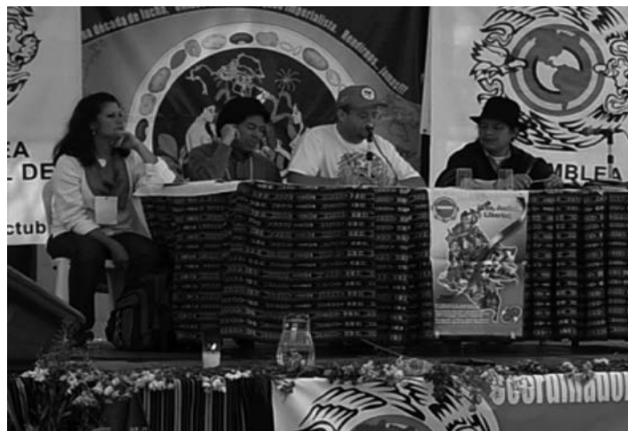
Irudia: © Coordinadora Latinoamericana de Organizaciones del Campo koordinakundearen IV. biltzarreko komunikazio-taldea.

"Viena+5" kontsulta-prozesuaren harira, Giza Eskubideen Adierazpen Unibertsala sinatu zenetik 50 urte bete zirela-eta, 1998ko irailean foro bat egin zen El Salvadorren; hain zuzen ere, Nazioarteko Foroa: Komunikazioa eta Herritarrak . Foro horretan, komunikazioaren inguruko eta mugimendu soziale-tako eragileak bildu ziren, denak ere komunikazioa demokratizatze ahaleginaren bueltan, eta NBERi eskatu zitzaion Komunikazioaren Mundu Gailur bat