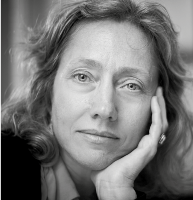
Irudia: © Manuel Ramírez Rovira.