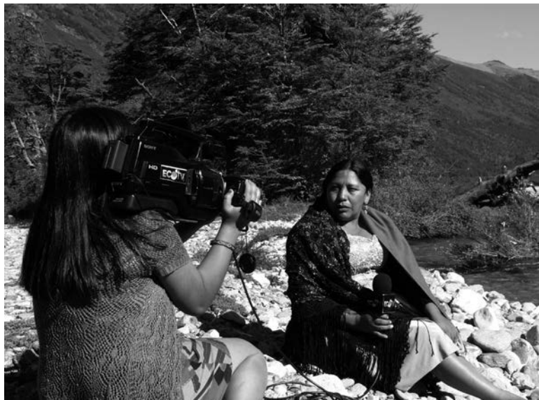
Irudia: © Jesus González Pazos.

Ildo horretatik, kontinenteko herri indigenak subjektu politiko historikotzat hartu behar dira une oro, hau da, beren historiaren, iraganaren, orainaren eta etorkizunaren egile subiranotzat. Eta erronka horretan bihurtzen da berezko komunikazioa, hain zuzen ere, lehen aipatu dugun oinarriko tresna estrategikoa. Horregatik, komunikazio hori ezin da mami politikotik bakandu, ez da apolitikoa; aitzitik, kritikaz eta autokritikaz osatua da, azterketaz eta