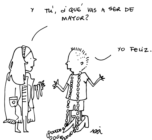
Ilustrazioa: © Isa Vázquez.

Uste dut agentziak zera esan nahi duela: interseksionala den eta halakotzat hartzen den toki batean egoitea, edo, nahi baduzue, elkarri lotutako ezaugarriak dituen toki batean (Lugones, 2008:80). Horri esker, tresna eta aliatu gehiago dituzu zure borrokarako, eta kontzeptu esparru bat duzu, non gizarte-mugimendu bateko kide baitzara, eta ez gauzak gertatzen zaizkion pertsona bat. Aldaketa hori funtsezkoa da gure gizarte parte-hartze sozialeko tresnak erabiliz eraldatzeko; bestela, norberak itxuraz merezi duen patu saihestezina besterik ez lirarteke izango.