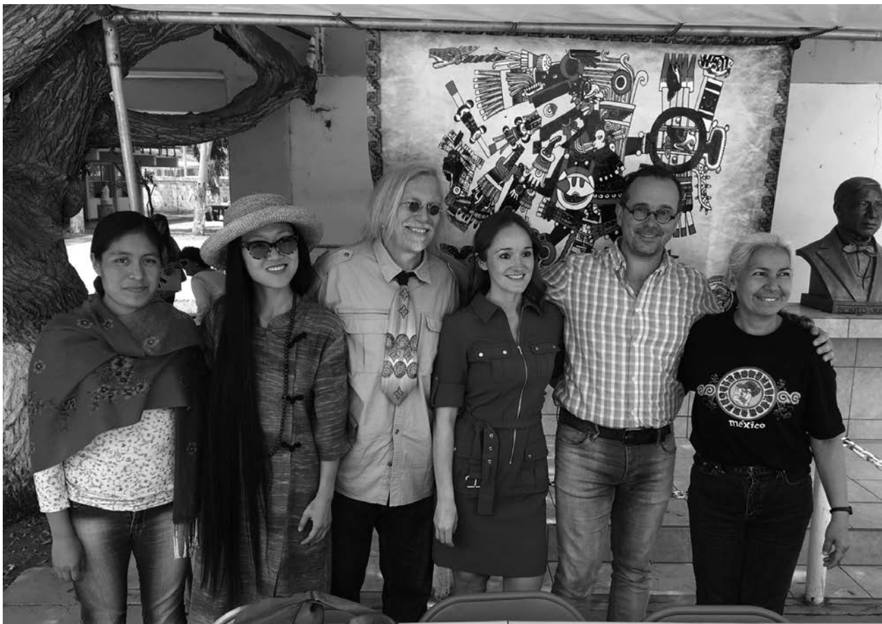
Peter McLarenek lagatako irudia.

Hori guztiori dela eta, pedagogia kritikoa nazioz gairik mugimendu sozial moduan bultzatzen saiatu naiz, hezitzaile progresistei kapitalismo garaikideko arazoei aurre egiten laguntzeko eta alternatibak bilatzeko. Aurrez aurre dugun kapitalismoak genozidioa, ekozidioa eta epistemozidioa sorrarazi ditu; azken termino horrek herri indigenen jakintza-moduen abolizioarekin dauka zerikusia. Beraz, iraultza luzea dugu aurretik.