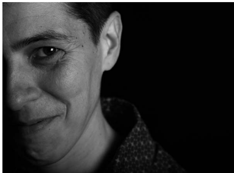
Irudia: © Eva Flórez.