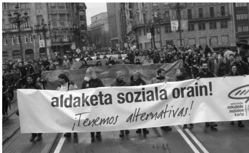
Irudia: Euskal Herriko Gizarte Eskubideen Gutunaren Koordinatzaile Nazionalaren argazki-artxiboa.

Gutunaren eduki ekologista, feminista, sozial, sindikal eta internazionalista nabaria da. Balio eta garrantzi handikoa da hainbaterakunde sozial eta sindikalek euren gain hartu izana, gizartearen goitik beherako aldaketaren aldeko apustuaren erakusgarri baita.