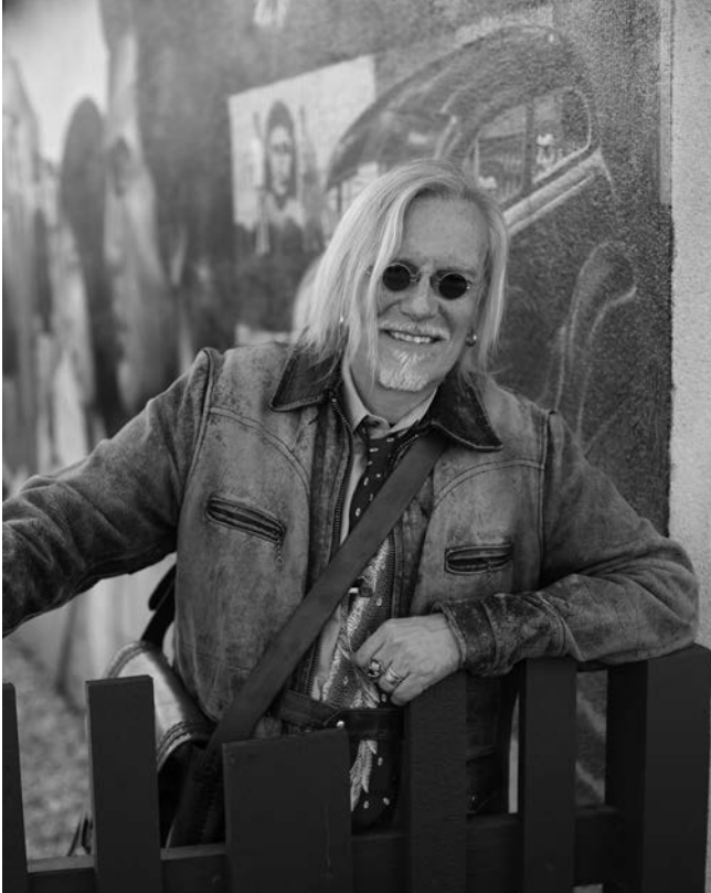
Peter McLarenek lagatako irudia.